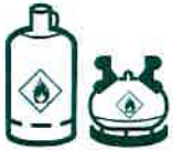
BOUTEILLES DE GAZ