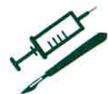
DASRI* DES PARTICULIERS