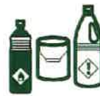
DÉCHETS DIFFUS SPÉCIFIQUES