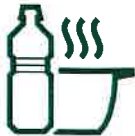
HUILES DE FRITURE